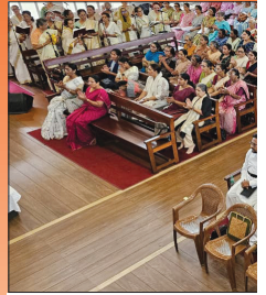
Ernakulam Centre Joi