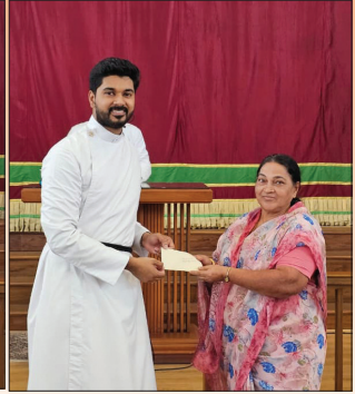
Sanghom Diocesan-level Talent Contest Prize Winners