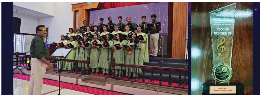
Our senior choir - 2nd runner up in the Symphonia hosted by St Thomas MTC, Kalamassery.