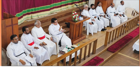
Joint Meeting of Sevika Sangam and MTVEA