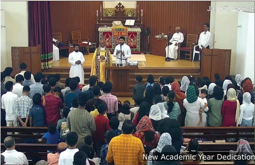
nts Dedication to the New Academic Year.