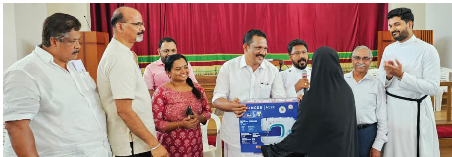
Distribution of Sewing machines & School kit by the Parish Vikasana Sanghom