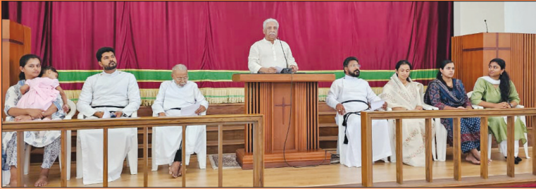
Welcoming the new Vicars to the Parish